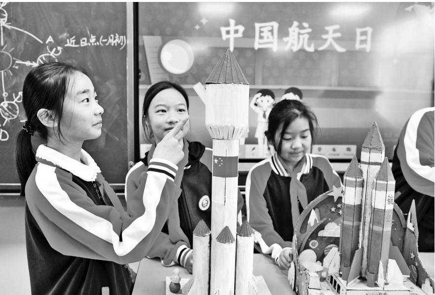
▲4月24日是第11个“中国航天日”。湖北省宜昌市秭归县实验小学举行“学习航天知识、点燃航天梦想”主题航天科普活动,通过学习航天知识、观摩航天器模型、手工制作航天器模型等方式,激发学生科技报国的梦想。图为学生在科学课堂上观摩航天器模型。

全省各地各校要严格按照要求,逐项落实各项体育工作举措,切实筑牢学生健康成长根基,全力推动学校体育工作提质增效。