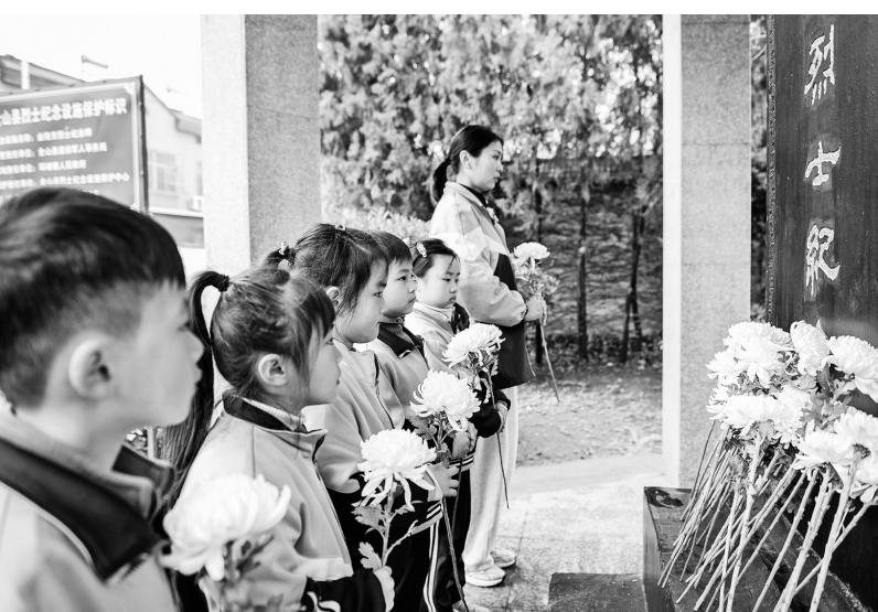
▲近日,安徽省马鞍山市含山县慈晖幼儿园开展“缅怀革命先烈 传承红色基因”清明节祭扫活动。孩子们走进金隆芳烈士纪念碑,通过献花、默哀、瞻仰等方式,寄托对烈士的深切哀思。

聚力资助育人融合,厚植成长滋养力。坚持“资助”与“育人”并重,推动资助与立德树人、思政教育、“三个课堂”、师德师风建设深度融合,通过扎实开展道德诚信教育、知恩感恩主题班会、社会实践志愿服务、励志成才宣传表扬等活动,搭建多元化资助育人平台,有效激发家庭经济困难学生从“被动”接受