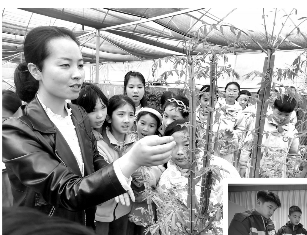
4月1日，江苏省中小学生迎来首个春假，江苏大学“江苏省物理学会科普教育基地”面向中小学生开放。图为南京市丁家庄小学、镇江实验学校和江苏大学附属学校的中小学生在物理演示与探究实验室参观体验。